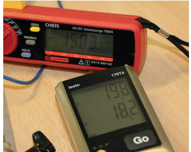
Abb. 2 Messwerte während der Prüfung Fig. 2 Measured values during a test

In addition to HF attenuation, another important criterion for any EMC cable gland is its current-carrying capacity – the ability of a component to conduct a specific continuous current. In the event of malfunctions, incorrect assembly or lightning strike, high currents can flow through the cable screen and the cable gland. The voltage drop due to the transfer resistance of a cable gland creates a loss based on the current flowing in the cable screen.