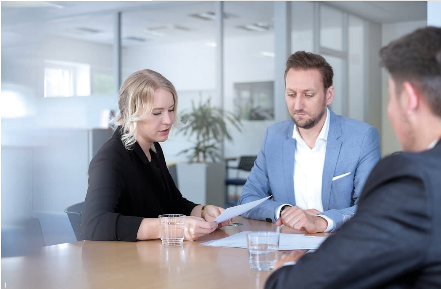
Abb. 1 – PFLITSCH Kundenbetreuer finden für Sie die passende Lösung Fig. 1 – PFLITSCH account managers will find the right solution for you

Our customer proximity can be test- ed and measured