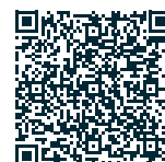
Abb. 1 – PFLITSCH Produktsuche – Produktauswahl treffen und individuelles Angebot anfordern Fig. 1 – PFLITSCH Product Search – select a product or products and request a quotation