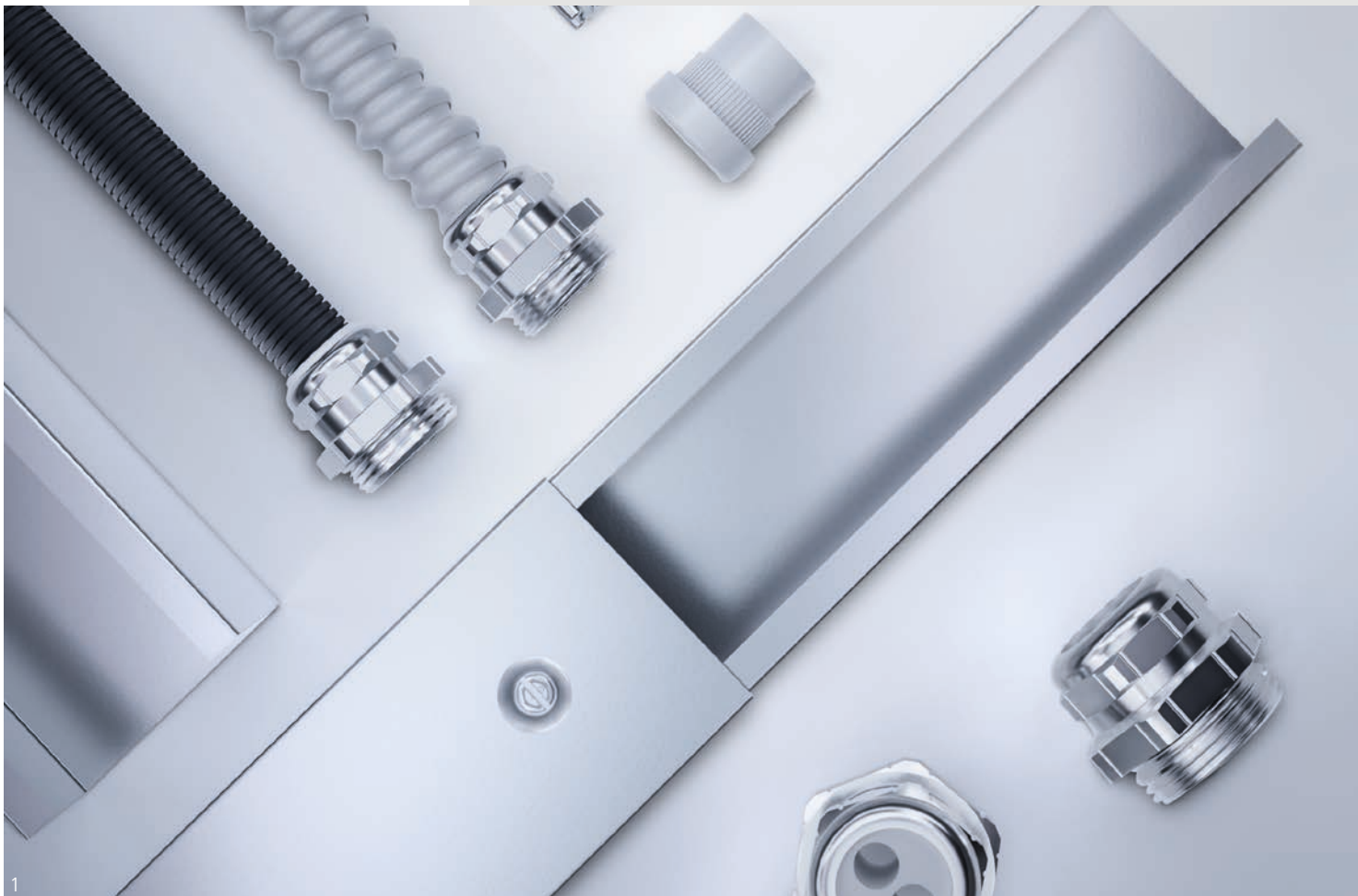
Abb. 1 – PFLITSCH Produktportfolio Fig. 1 – PFLITSCH product portfolio