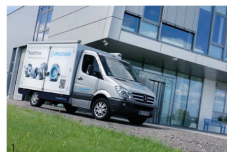
Abb. 1 – PFLITSCH Showfahrzeug Fig. 1 – PFLITSCH show truck