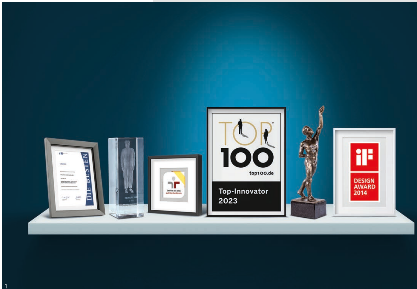
Abb. 1 – Zahlreiche Auszeichnungen unterstreichen unsere Leistungs- fähigkeit Fig. 1 – Numerous awards underline our performance

Strong performance that makes a difference