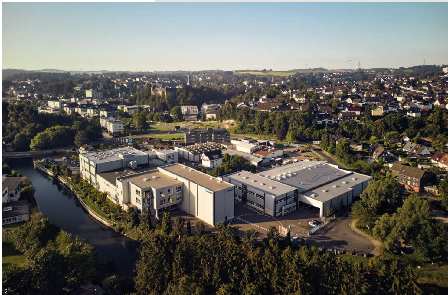
Abb. 1 – Werk II – PFLITSCH Kompetenzzentrum für Kabelkanäle Fig. 1 – Plant II – PFLITSCH centre of competence for cable trunking