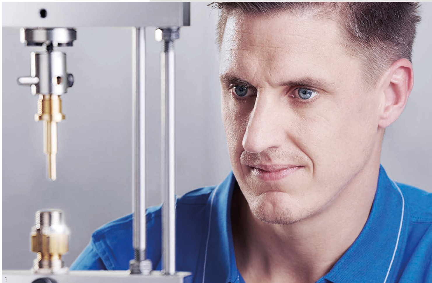
Abb. 1 – Im PFLITSCH Labor werden Kabelverschraubungen umfang- reich geprüft Fig. 1 – Cable glands are extensively tested in the PFLITSCH laboratory.

Strong brands for the highest quality standards