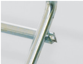
Drahtsteg mit Bolzenschneider abgekniffen