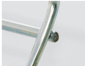
Drahtsteg mit Gitter-Kanalschere abgetrennt